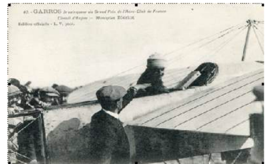
1912 - Garros au Circuit d'Anjou

1912 (11 décembre) - Tunis - Garros atteint 5 610 mètres, à bord d'un Morane-Saulnier - Nouveau record du monde d'altitude !