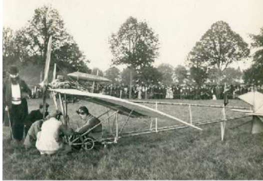
1910 – Garros et sa Demoiselle à la Ferté-Vidame (Eure-et-Loir)

1909 (25 septembre - 17 octobre) - 1 er Salon de l'Aéronautique (1 re Exposition Internationale de Locomotion Aérienne), au Grand Palais